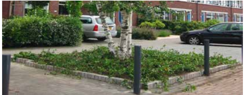
▲ Voorbeeld van een boom met waterbuffer en de juiste invulling van de boomspiegel.

Er kunnen diverse materialen gebruikt worden voor de waterbuffer en de toevoer of aanvoer. Omdat het